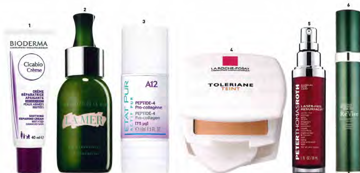
KLEINE UNTERSTÜTZER 1 Lindert den Juckreiz: „Cicabio Crème“ von Bioderma, um 10 Euro 2 Unterstützt den Heilungsprozess: „The Concentrate“ von La Mer, um 290 Euro 3 Rekonstruiert die Hautmatrix nach dermatologischen Behandlungen: „Peptid-4 Pro-Collagen A12“ von Etat Pur, um 16 Euro 4 Kaschiert Narben: „Toleriane Teint“ von La Roche-Posay, um 17 Euro 5 Boostet die Hautregeneration: „Laser-Free Resurfacer“ von Peter Thomas Roth, um 125 Euro 6 Schützt wunde Stellen vor freien Radikalen: „Defensif Renewal Serum“ von RéVive, um 210 Euro