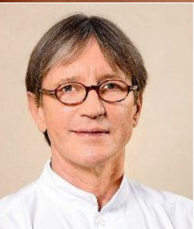
Botox-Injektionen gehören unbedingt in die Hände eines erfahrenen Arztes