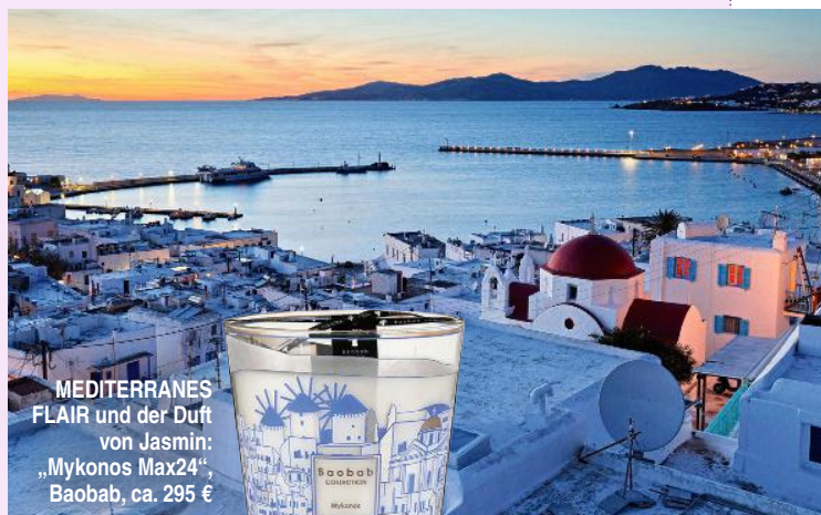
MEDITERRANES FLAIR und der Duft von Jasmin: „Mykonos Max24“, Baobab, ca. 295 €